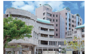
沖縄県男女共同参画センター

開催日：2020年1月29日(水) 開催時間：受付 14:00、開始 14:30 終了 17:30 場所：沖縄県男女共同参画センター ているる 沖縄県那覇市西 3-11-1 Tel 098-866-9090 定員：50名(先着順) 受講料：無料